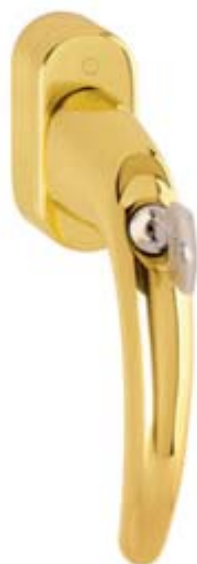
modello ATLANTA tipo martellina DK con cilindro versione Secu TBT4 materiale ottone