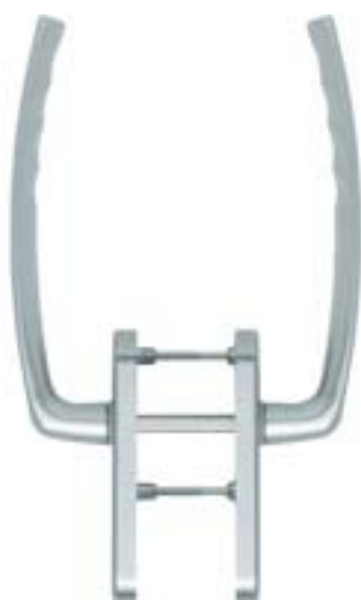
modello ATLANTA tipo maniglione a coppia versione standard materiale alluminio