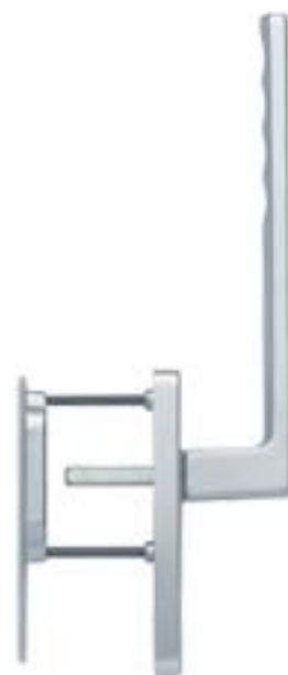
modello TOULON tipo maniglione singolo con maniglietta da incasso esterna versione standard materiale alluminio