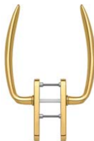
modello ATLANTA tipo maniglione a coppia versione standard materiale ottone