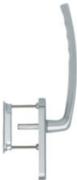
modello ATLANTA tipo maniglione singolo con maniglietta da incasso esterna versione standard materiale alluminio