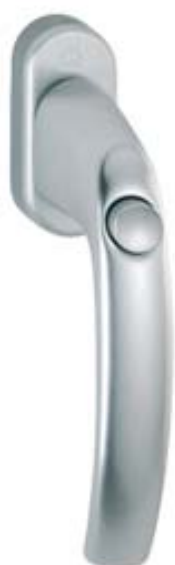
modello ATLANTA tipo martellina DK versione con pulsante materiale alluminio