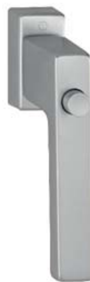
modello TOULON tipo martellina DK versione con pulsante materiale alluminio