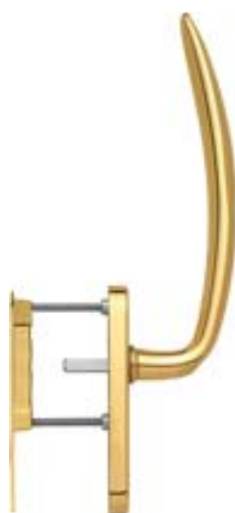
modello ATLANTA tipo maniglione singolo con maniglietta da incasso esterna e serratura versione standard materiale ottone