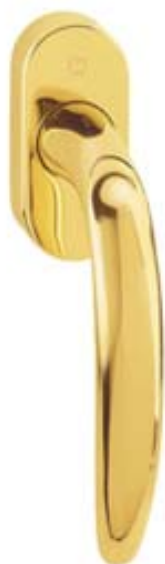
modello ATLANTA tipo martellina DK con cilindro versione Secu TBT4 materiale ottone