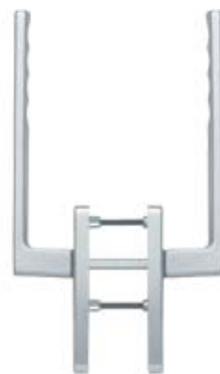
modello TOULON tipo maniglione a coppia versione standard materiale alluminio