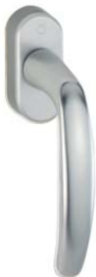
modello ATLANTA tipo martellina DK versione Secustik materiale alluminio