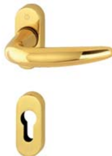
modello ATLANTA tipo guarnitura (maniglia/maniglia) versione guarnitura su rosetta materiale ottone