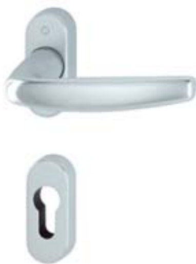
modello ATLANTA tipo guarnitura (maniglia/maniglia) versione guarnitura su rosetta materiale alluminio