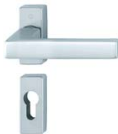
modello TOULON tipo guarnitura (maniglia/maniglia) versione guarnitura su rosetta materiale alluminio