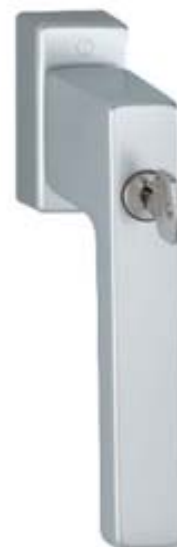
modello TOULON tipo martellina DK con cilindro versione Secu TBT4 materiale alluminio