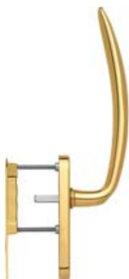
modello ATLANTA tipo maniglione singolo con maniglietta da incasso esterna versione standard materiale ottone