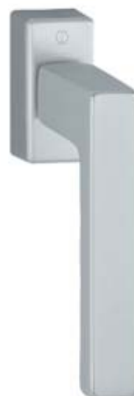
modello TOULON tipo martellina DK versione Secustik materiale alluminio