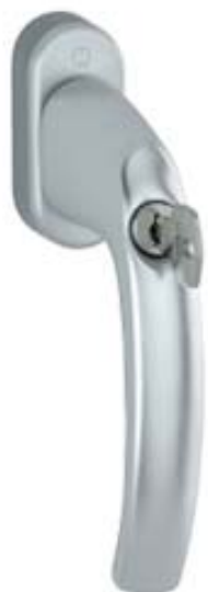
modello ATLANTA tipo martellina DK con cilindro versione Secu TBT4 materiale alluminio