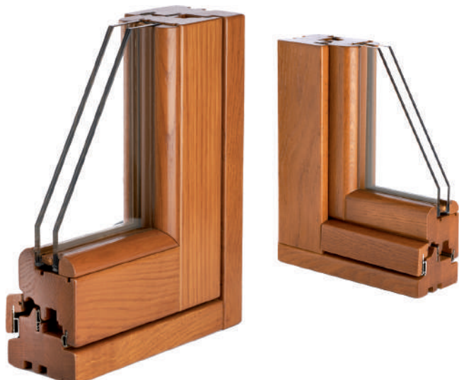
in foto la versione SLIM