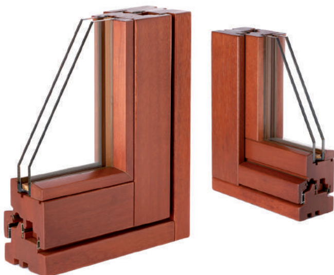
in foto la versione SLIM