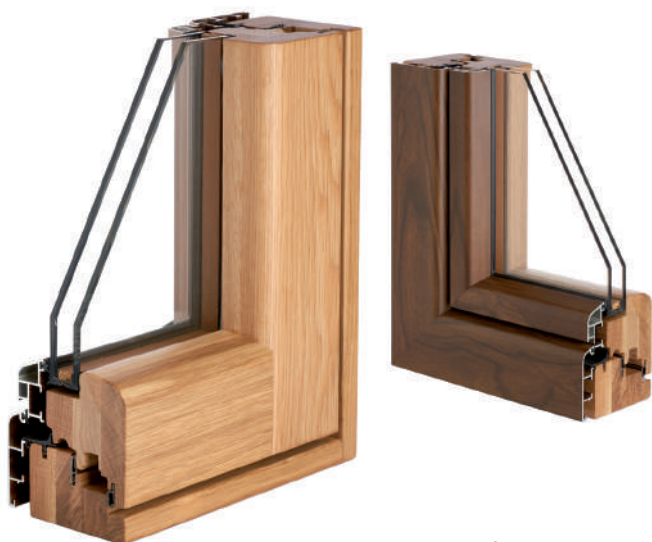
in foto la versione SLIM