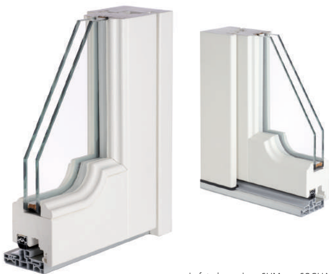
in foto la versione SLIM con SOGLIA