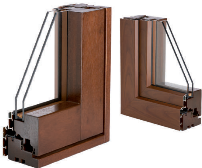
in foto la versione SLIM