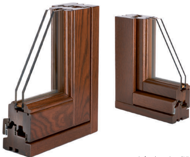
in foto la versione SLIM