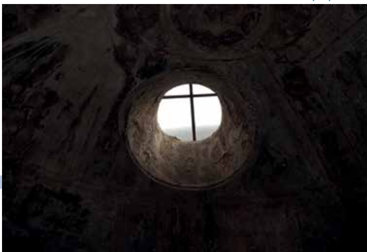
Thermae di Pompei part. oblò

Pompeja si posiziona nel solco della storia di questo fondamentale manufatto, ne raccoglie le suggestioni dell'origine ed è quotidianamente impegnata alla realizzazione di finestre che ambiscono alla perfezione.