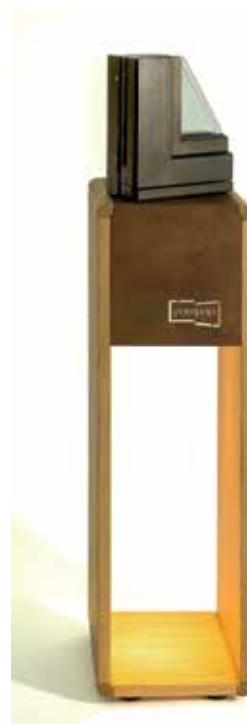
Espositore angoli da vetrina Pompeja design arch. Pino Cappuccio