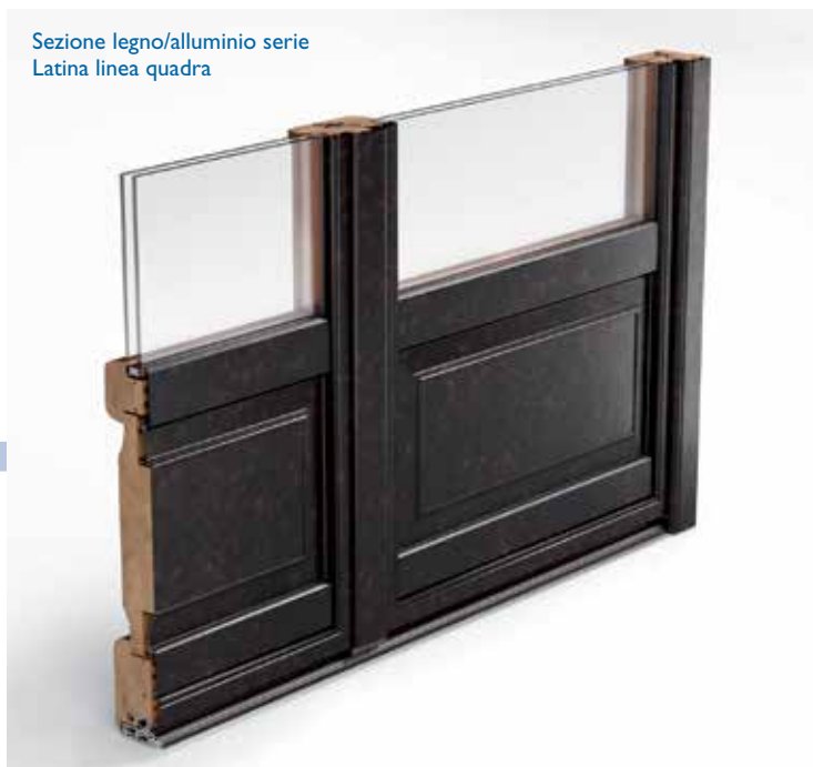
Sezione legno/alluminio serie Latina linea quadra