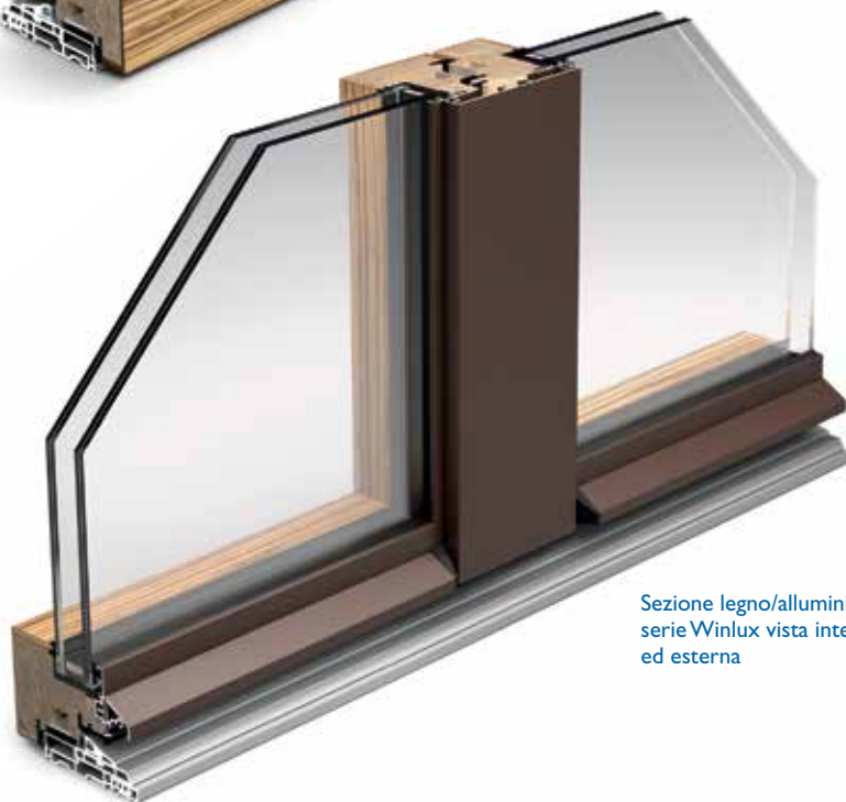
Sezione legno/alluminio serie Winlux vista interna ed esterna