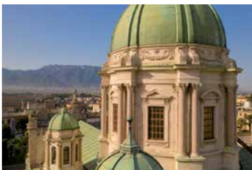
Basilica del Santuario a Pompei: la sovrintendenza archeologica ha condiviso la scelta del progetto per il serramento.

A quest'ultima si aggiunge una sistematica verifica a campione dei serramenti, anche loro certificati da diversi Enti, quali il Consorzio LegnoLegno, Istedil e t2i.