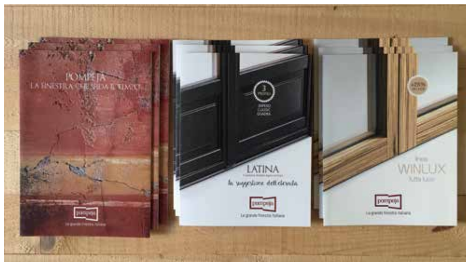
Brochure e pubblicazioni Pompeja